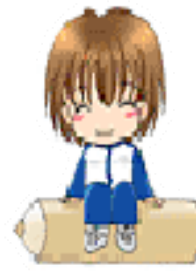
子森 06 / 26