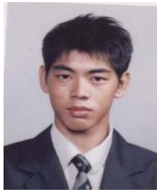
立哲 06 / 23