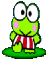
德茂 06 / 10